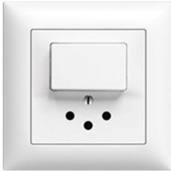
Der klassische Wandschalter

Die Leuchte wird mit dem gewohnten Schalter, wie wir ihn alle zu Hause haben, gesteuert. Die Funktionen Ein/Aus sind dabei möglich.